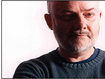
John Peel was one of the UK's most-loved broadcasters

Veteran BBC broadcaster John Peel has died at the age of 65, while on holiday in Peru.